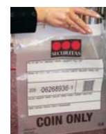
Sigurna vreća za kovanice sa zaštitom od otvaranja