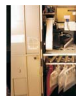
Unutrašnjost uređaja opremljenog vrećama